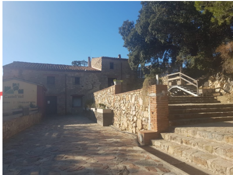
El Castell Vell Llinars de Vales max 90pl