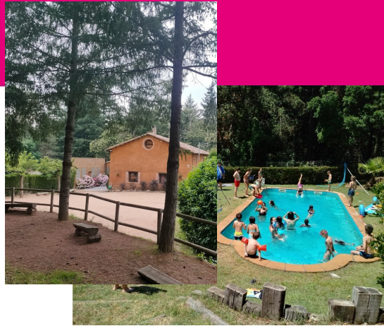
El Corral del Montseny max 80pl