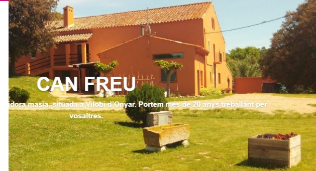
Can Freu Girona max 100 pl