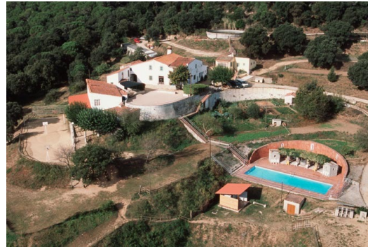
Can Clarens del Vallgorguina max 80pl