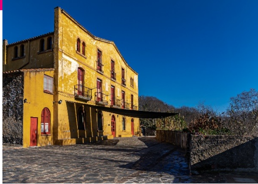
La Farga del Montseny, max 80pl