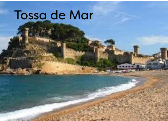
Tossa de Mar